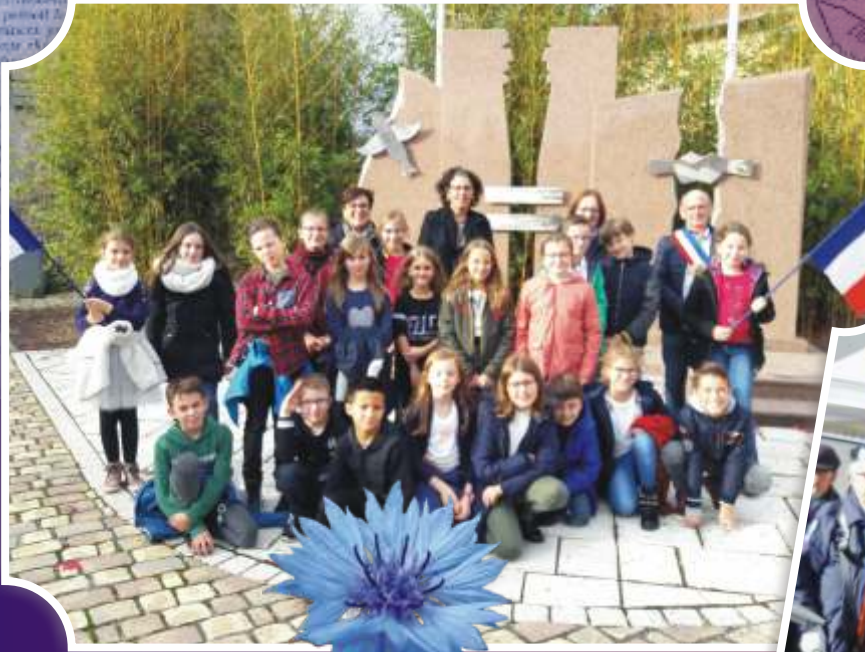
100 e anniversaire de l'Armistice de 1918