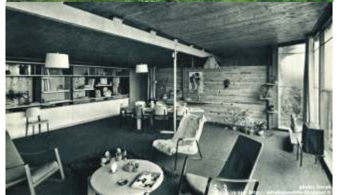
Sa maison de Nancy construite en 1954, « icône de l'architecture du 20 e siècle. »