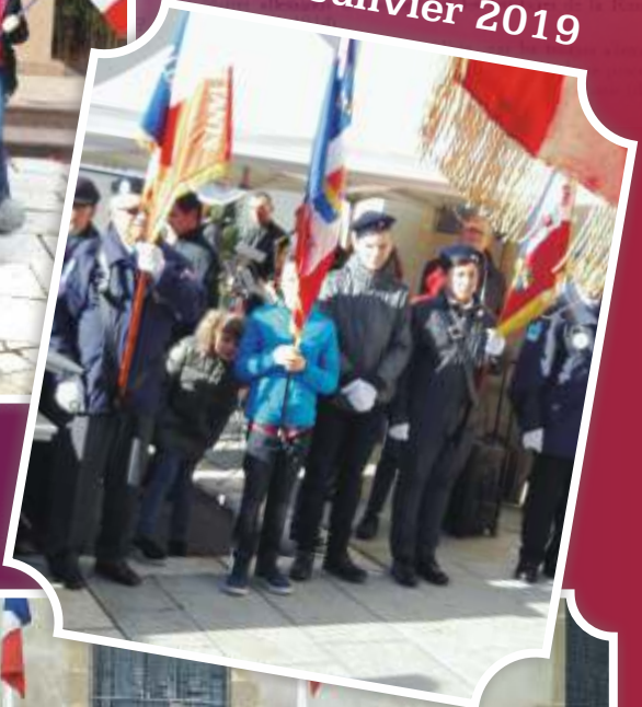
N°94 Janvier 2019