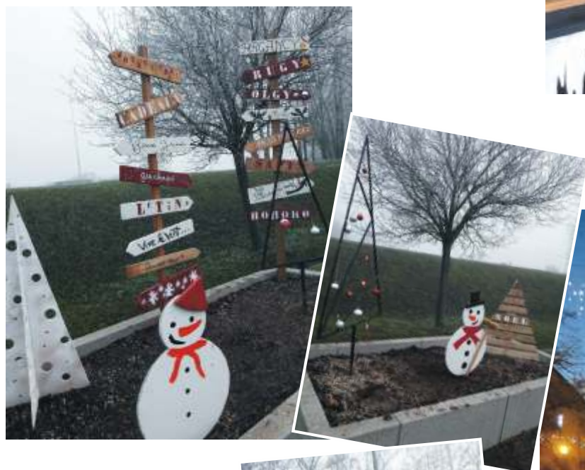
Mise en lumière de la place

Les décorations à l'entrée d'Argancy ont été entièrement réalisées par le service technique avec des matériaux de récupération.