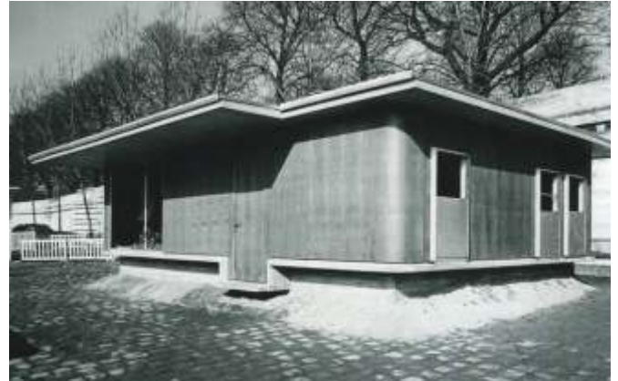
La maison des jours meilleurs pour l'Abbé Pierre en 1956

Jean Prouvé demeure pourtant sous bien des aspects un personnage énigmatique et ambigu : il a rêvé d'industrialisation à grande échelle (produire des maisons comme on fabrique des voitures), mais sa production est restée relativement artisanale. Ses principes constructifs sont ingénieux : simplicité de conception, légèreté des matériaux et rapidité de l'assemblage.