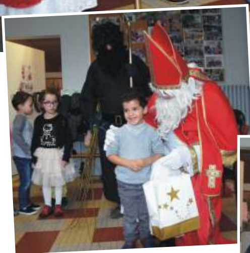
Sourires et gros câlins !