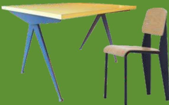
Table compas et chaise standard

Jean Prouvé voulait concevoir des meubles de série, avec une économie de moyens, faciles à monter et surtout bon marché. Aujourd'hui, une de ses chaises, considérée comme une œuvre d'art, peut être vendue 10 000 € aux enchères ! Enfin, un fabricant allemand a décidé de rééditer certaines de ses œuvres.