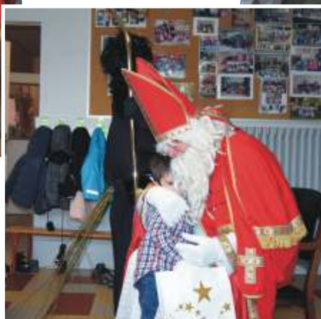
Ce n'est pas tous les jours qu'on rencontre Saint Nicolas. Voici un joli noeud papillon qui a fait forte impression !